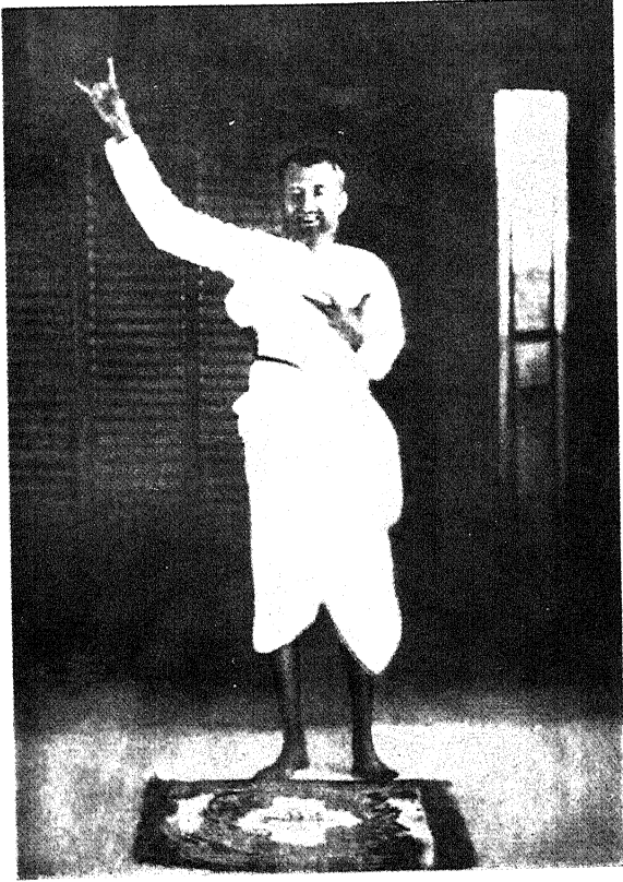
समाधिस्थ श्रीरामकृष्णदेवः ।